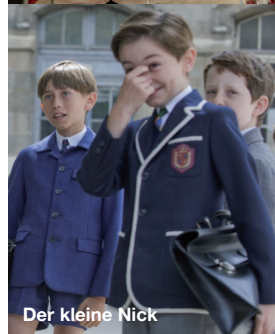
Der kleine Nick